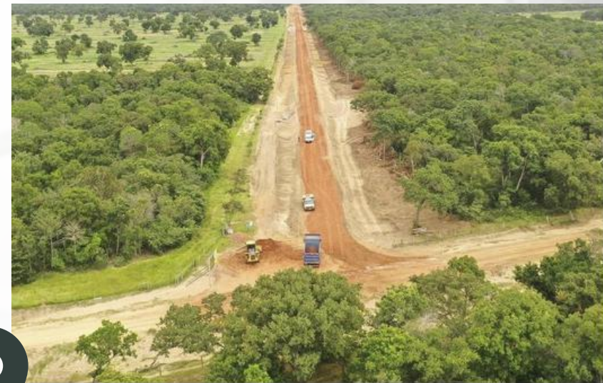
PROJETO DE RODOVIA EM REVESTIMENTO PRIMÁRIO COM 54 KM DE EXTENSÃO NO PANTANAL DA NHECONLÂNDIA NO MATO GROSSO DO SUL