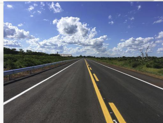
PROJETO DE IMPLANTAÇÃO E PAVIMENTAÇÃO DE RODOVIA COM 40 KM DE EXTENSÃO NA REGIÃO DE CHAPADÃO DO SUL/MS