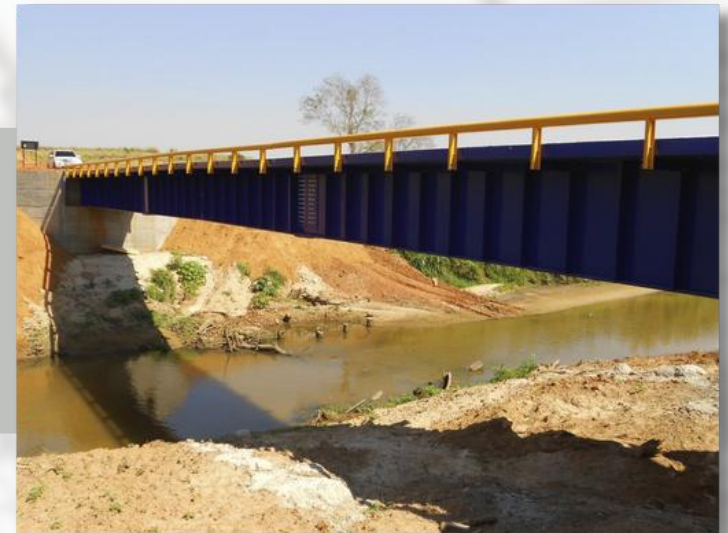
PROJETO EXECUTIVO E GERENCIAMENTO DE PONTE MISTA COM 40 METROS DE VÃO EM PRESIDENTE BERNARDES, REGIÃO OESTE DO ESTADO DE SÃO PAULO