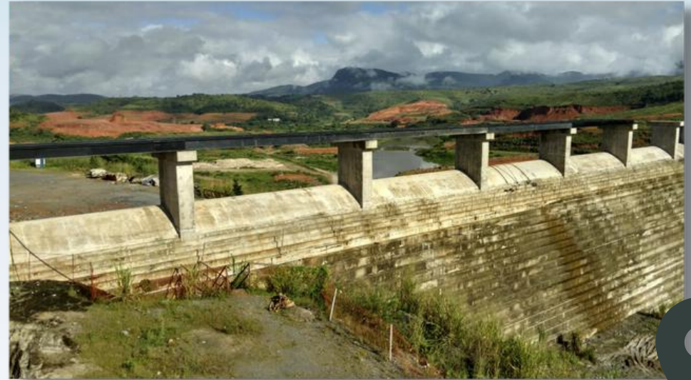
ADEQUAÇÃO DE PROJETO, SUPERVISÃO E GERENCIAMENTO DE SUPERESTRUTURA DE PONTE MISTA COM 140 METROS DE EXTENSÃO, NO ACESSO A BARRAGEM SERRO AZUL EM PERNAMBUCO